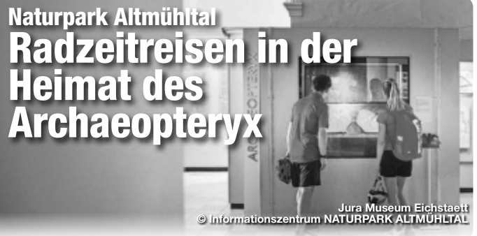
Jura Museum Eichstaett

Noch mehr auf TreffpunktDeutschland.de QR-Code scannen und ganz Deutschland entdecken!