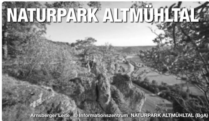
Arnsberger Leite

Reiseführer. Reisemagazine. Freizeittipps. Alle Termine und Angaben unter Vorbehalt!