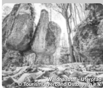
Waldhaabtal - Uferpfad

Herrlich entspannte Urlaubstage genießen im Naturpark Altmühltal. In sanften Kurven schlängelt sich die Altmühl durch eine Landschaft, die ideal ist für Aktive und Naturgenießer. Vorbei an Jurafelsen und sonnigen Wacholderheiden fahren Radwanderer auf einem der beliebtesten Radwege Deutschlands, dem Altmühltal-Radweg. Auf 166 Kilometern folgt er dem Fluss von Gunzenhausen aus durch den Naturpark Altmühltal bis zur Donau in Kelheim. Der Altmühltal-Radweg ist eine fabelhafte Route für Genussradler: naturnah, eben und stressfrei fernab des Straßenverkehrs. Der perfekte Weg für entspannte und entspannende Wanderungen im Naturpark Altmühltal ist der Altmühltal-Panoramaweg. TreffpunktDeutschland.de/altmuehlal