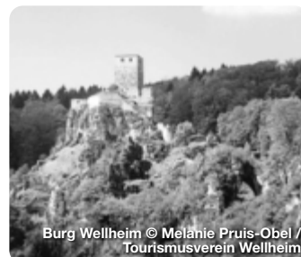
Burg Wellheim

Das Urdonautal rund um Wellheim, über dem weithin sichtbar die majestätische Burgruine thront, liegt als Ausläufer des Altmühltals zwischen Eichstätt und Neuburg/Donau. Es gehört zu den 100 schönsten Geotopen Bayerns und ist mit zahlreichen gut ausgeschilderten Wanderwegen ein tolles Ausflugsziel für alle Naturliebhaber. Hier entspringt die Schutter, die sich durch das romantische Tal bis nach Ingolstadt schlängelt. Auf dem zertifizierten Qualitätswanderweg Urdonautalsteig finden Sie ein ganz besonderes Wandererlebnis durch Wälder, über Trockenrasenhänge und vorbei an beeindruckenden Felsformationen mit vielen spektakulären Aussichtspunkten sowie Kultur- und Natursehenswürdigkeiten. TreffpunktDeutschland.de/wellheim