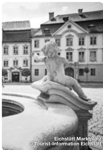
Eichstätt Marktplatz